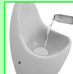
Neue Sperrflüssigkeit (100 ml) einfüllen.