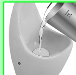
Siphon mit etwa 2 L Wasser befüllen (wichtig).