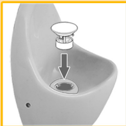
Duftstoffkorb wieder einstecken.