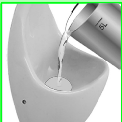
Urinal mit 5 L Wasser spülen.