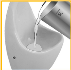
Urinal mit 5 L Wasser spülen.