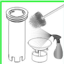
Siphoneinsatz und Duftstoffkorb mit einer Bürste von grobem Schmutz reinigen.