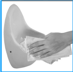
Das Becken mit einem Tuch abwischen.