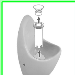
Siphoneinsatz herausziehen und Duftstoffkorb entfernen.