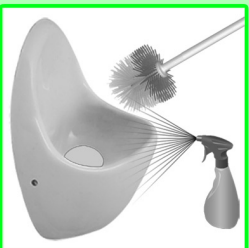
Die Siphonöffnung mit einer Bürste von grobem Schmutz reinigen.