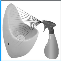
Urinal mit Senza Aqua Clean einsprühen und 5 Minuten einwirken lassen.