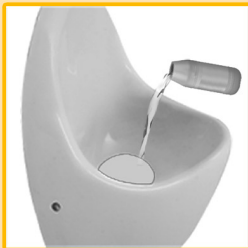
Neue Sperrflüssigkeit (100 ml) einfüllen.